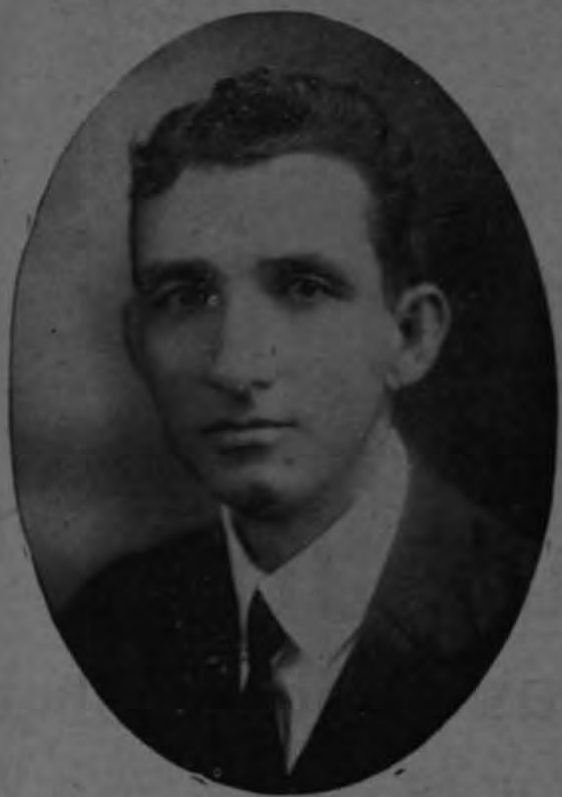
don León Cortés Castro, Secretario de Estado en el Despacho de Fomento, quien presidió la fiesta

Una nota de alta cultura ha sido dada por la Federación Gráfica Costarricense con el baile efectuado anoche en el Teatro Nacional, el cual presidió el señor Secretario de Estado don León Cortés Castro. Rematados en todos los detalles de una magnífica organización los motivos de la